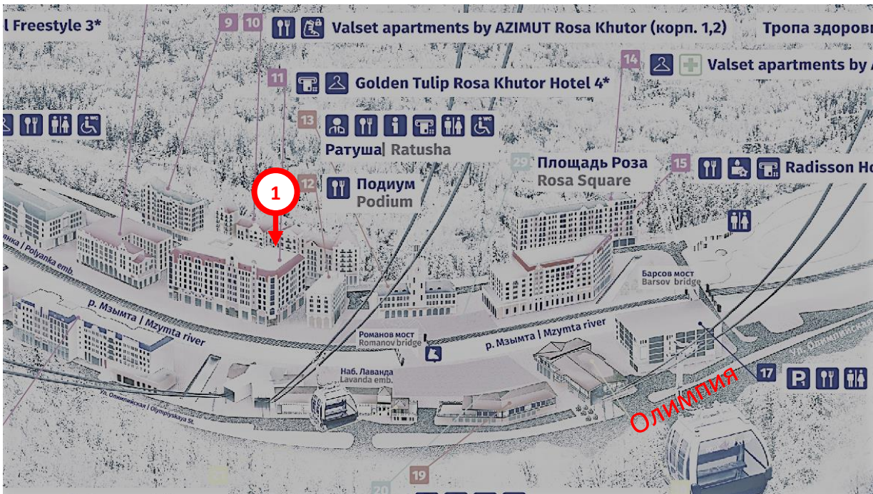
Роза Плато (Горная олимпийская деревня):